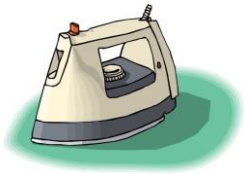
le fer à repasser